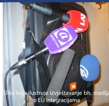
Slika koja ilustruje izvještavanje bh. medija o EU integracijama