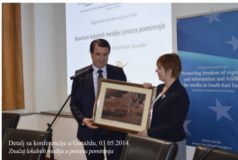
Detalj sa konferencije u Goraždu, 03.05.2014. Značaj lokalnih medija u procesu pomirenja