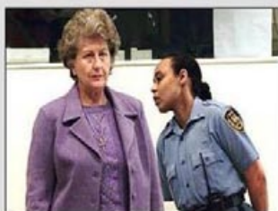
Biljo, ostaješ iza brave!!!

Švedska je saopštila da je odbila i drugi zahtjev haške osuđenice i bivše predsjednice Genocidne Tvorevine Biljane Plavšić (78) da bude puštena na slobodu.