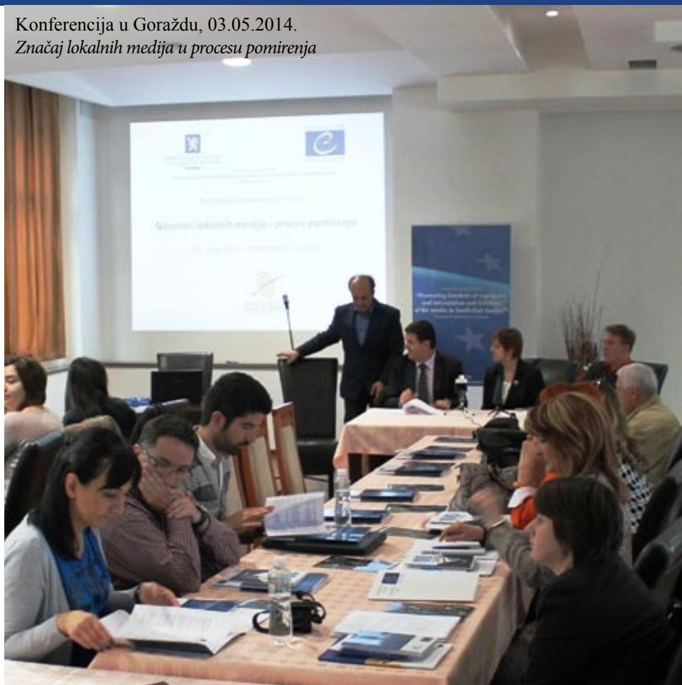
Konferencija u Goraždu, 03.05.2014. Značaj lokalnih medija u procesu pomirenja