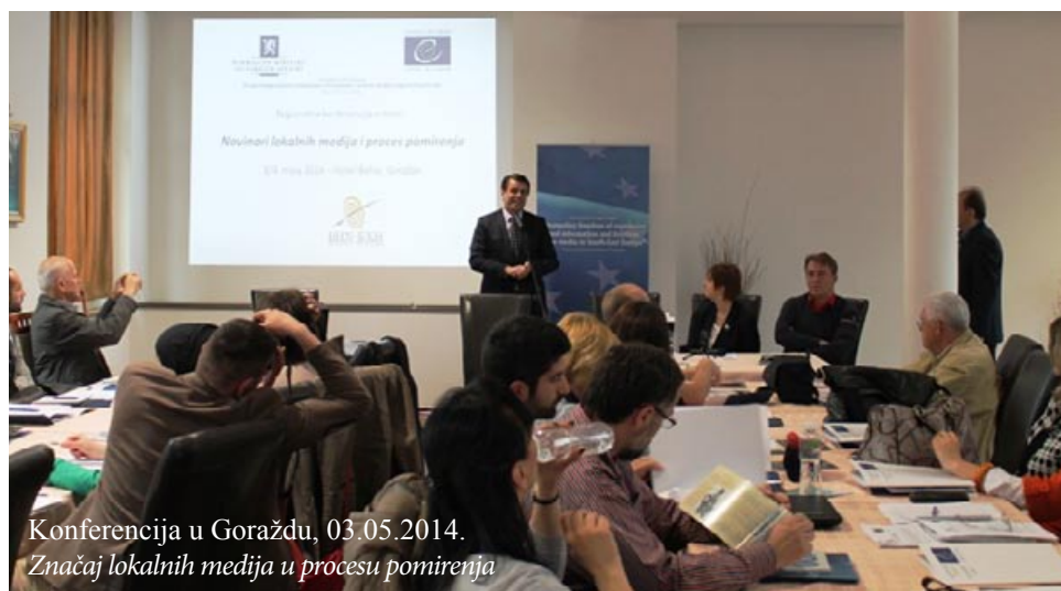
Konferencija u Goraždu, 03.05.2014. Značaj lokalnih medija u procesu pomirenja

Došlo je do situacije kada je vlast javno progovorila o vođenju pogrešne politike u određenom vremenskom periodu. U medijima se također govorilo o toj takvoj politici, i govori još uvijek s obzirom na to kako nas sustižu posljedice te takve politike. Važno je to što se uopšte o tome govori i dobro je što se o tome govori. Ali negativna strana koja prati sve to jeste pretjerano manipulisanje informacijama i pre naglašavanje određenih činjenica, dok druge, iako su također relevantne i aktuelne, vješto, najviše umijećem novinara, skliznu u drugi plan. Tako će se u emisiji, koja traje najmanje 40 minuta, 5 minuta govoriti o temi