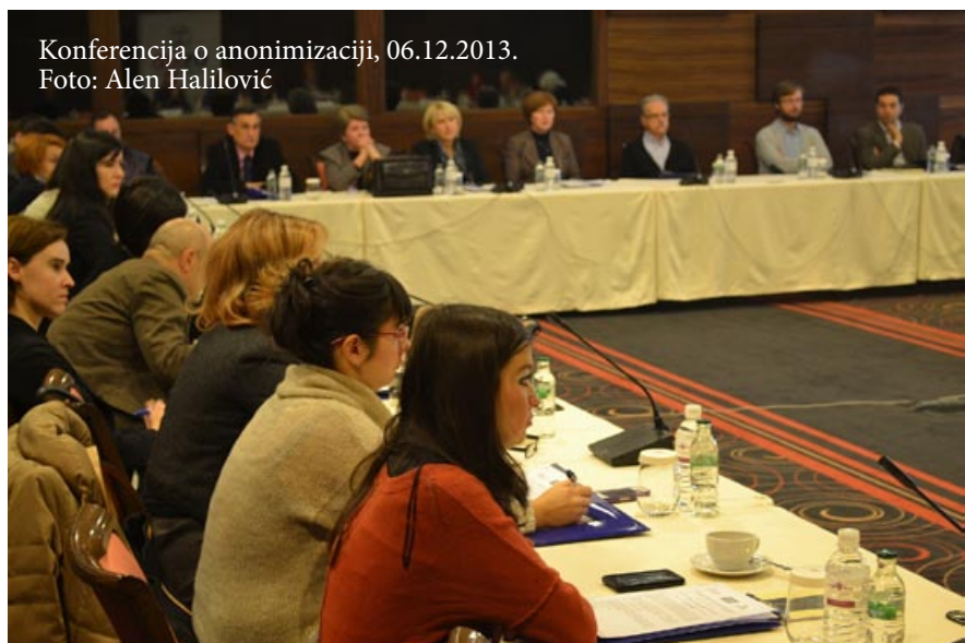
Konferencija o anonimizaciji, 06.12.2013.

"Mi smo protiv automatske obrade podataka – međutim, Zakonom o zaštiti ličnih podataka se dozvoljava objava ukoliko postoji javni interes. U najtežim krivičnim djelima vidimo da moramo imati imena i prezimena. To je značajno zbog budućih pokoljenja i pomirenja. Međutim, u ovim perifernim djelima će se izvršiti testiranje javnog interesa, što se može uraditi kroz broj