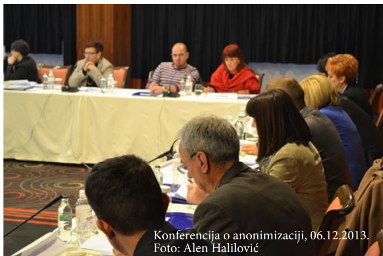
Konferencija o anonimizaciji, 06.12.2013.