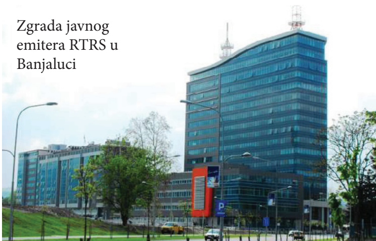
Zgrada javnog emitera RTRS u Banjaluci

Narodna Skupština RS je oktobru 2013 godine ozakonila eliminaciju RAK-a prilikom izbora članova Upravnog odbora RTRS i ozakonila namicanje nedostajućih sredstava iz Bužeta RS-a. S ove dvije intervencije RTRS je i formalno stavljen pod kontrolu vladajuće većine i derogirani su principi Zakona o sistemu JRTS BiH. U toku je još jedna izmjena koja omoćava NSRS da smjeni članove Upravnog odbora ako ocjeni da ne izvršavaju očekivanu ulogu. Istovremeno, RTRS je od RAK-a dobio odobrenje za novi kanal koji je podveden pod „dodatni programski servis“, što vodi potpunoj emencipaciji od sistema javnog RTV emitiranja u BiH.