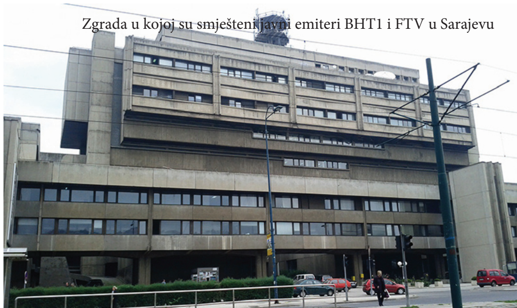
Zgrada u kojoj su smješteni javni emiteri BHT1 i FTV u Sarajevu

Javni servisi u Bosni i Hercegovini razapeti su između međunarodne zajednice, političkih lidera, etničkih javnosti, podijeljene novinarske javnosti i ekonomskih moćnika i tapkaju u mjestu više od 15 godina, što jest relativno kratak period, ali i iznimno dugačak u uvjetima brzih tehnoloških i legislativnih promjena u EU kojoj se u konačnici teži. Jedinstveni javni servis u Bosni i Hercegovini trenutno nije moguć i neće biti moguć sve do onog momenta kada se suštinski ne dese politički pomaci u pravcu integriranja zajednice u cjelinu zasnovanu na demokratskim principima i isključivo građanske opcije. Strategije ili ukidanja ili disolucije javnih servisa vode istoj konačnici: regresiji procesa tranzicije ka suvremenim demokratskim sistemima i konačnoj podjeli društvene zajednice. A građani to ne smiju dopustiti. Ako ih iko bude pitao.